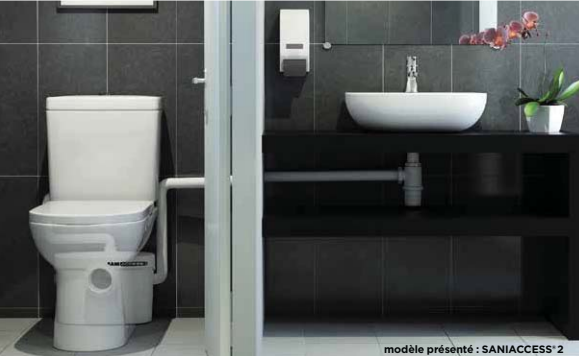
modèle présenté : SANIACCESS® 2