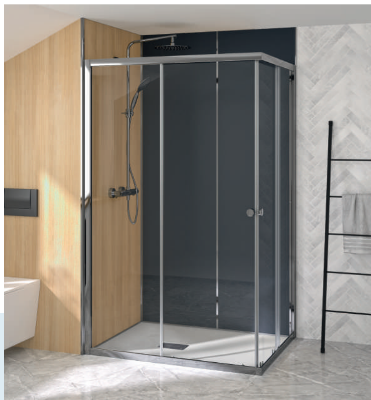
Supra A - profilé chromé - verre transparent